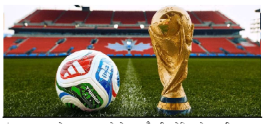
संयुक्त रूपमा हुने पक्का भइसकेको अख्तो हुने भए। नेपाल पनि अहिले विश्वकपमय भइसकेको छ। विश्वकप फुटबल समावेश अहिले नै आफूलाई मनपरे फुटबल टिमको टिसट लगाएर अथवा खेलौडाहरूको शीला 'क्याप' गरेर विश्वकपको यस पर्वमा मस्त भइसकेका छन्। नेपालका तुलनामा सहरका पसलमा आआफ्ना मनपरे टिमको जर्सी खरिद गर्ने बहेका छन्। होटल र रेस्टुरेन्टहरू पनि यस अवसरमा विशेष योजना बनाइरहेका छन्।