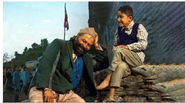
काठमाडौं/बिद्यालयमा विद्यार्थीहरूलाई गरिने व्यवहार, उनीहरूलाई हुने अत्याचार, गरिबी र नेपालको शिक्षा प्रणालीको कठोर वास्तविकतालाई चलचित्र 'रोल नं १' ले पढाउने उतारेको छ।