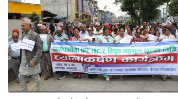
उपलब्ध गराए उपभोक्ताहरूले सतौमा खानेपानी सेवा पाउने बताए।

उनले सरकारले खानेपानी क्षेत्रलाई प्राथमिकतामा राख्नुपर्नेमा जोड दिए। नयाँ सरकार गठनपछि खानेपानी मन्त्रालयलाई शहरी विकास मन्त्रालय तथा भूतिका पदाधार मन्त्रालयसँग गाभेर पदाधार विकास मन्त्रालय बनाएकाले खानेपानी तथा सरकारी क्षेत्र अख्तियार पनि चलाउनु पर्ने उक्ते भन्नु भयो। कृषि मन्त्रालयमाथि योजना कार्यान्वयन प्रभावकारी हुने बताए।