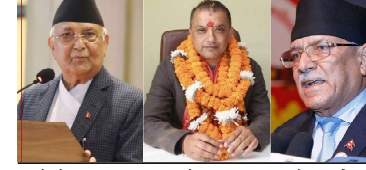
काठमाडौँ/फागुन २१ को निर्वाचन नतिजाबारे सदस्यमा सानो आकारमा बुकिचएका नेपाली कांग्रेस, नेकपा (एमाले) र नेकपा(वि.स.व.)का लागि गठबन्धन बनाउने सहकार्य सुरु भएको छ।