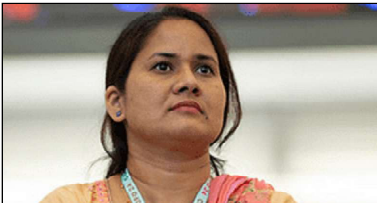
प्रतिक्रिया फिट ७ हजार देखि ८ हजार रूपैयाँसम्म पुगेको छ।

नेपालको वन क्षेत्रमा पर्याप्त काठ भए पनि नीतिगत अस्पष्टता र कर्मचारीतन्त्रको नियन्त्रणमुद्धी मानसिकताका कारण उपभोक्ता महँगो मूल्य तिर्न बाध्य छन्। कानुनी त्रास र फर्कानोटको प्रक्रियाले गर्दा हलापडा काठ जंगलमै सडेर जाने अवस्था छ, जसले गर्दा मानिसहरू कुष्ठरोग सामग्री प्रयोग गर्ने विषय छ। वन व्यवस्थापनलाई हित उन्नयनमा जोड्दै प्रक्रिया सरलीकरण गरेमा मात्र स्वदेशी वनबाट समृद्धि हाँसिल गर्न सकिने अवस्था छ।