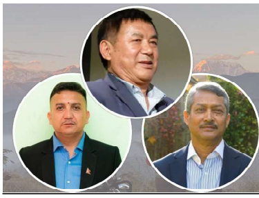
नेपालमा हालसम्म शनिवार मात्र विदा हुँदा आन्तरिक गन्तव्यमा जनसमाज अभाव हुने गरेको थियो। अब शुरुवात कार्यालय समय सकिएलगत्तै निस्कन सकिने र शनिवार तथा आइतबार गन्तव्यमा बिताउन पाइने भएपछि विकेन्ड कल्चर (सप्ताहान्त संस्कृति) फेटाउने व्यवसायीहरूको अनुमान छ। यसले प्रमुख पर्यटकीय क्षेत्रमा चाप बढाउने आशा व्यवसायीहरूले गरेका छन्। पर्यटन व्यवसायीहरूका अनुसार आन्तरिक पर्यटकले विदेशी पर्यटकको तुलनामा दुई खर्च गर्ने प्रवृत्ति छ। दुई दिन विदा दिने निर्णयले पर्यटन उद्योगमा प्रत्यक्ष लाभ पुग्ने उनीहरूको भनाइ छ।

काठमाडौं: सरकारले सातामा दुई दिन (शनिवार र आइतबार) सरकारी कार्यालयलाई विदा दिने निर्णय गरेसँगै नेपाली पर्यटन व्यवसायीमा उत्साह बढिएको छ। कोरोना महामारी र आर्थिक मन्दीका कारण सुस्ताएको पर्यटन क्षेत्रलाई यस निर्णयले टेवा पुग्ने अपेक्षा उनीहरूको छ। नेपालमा हालसम्म शनिवार मात्र विदा हुँदा आन्तरिक गन्तव्यमा जनसमाज अभाव हुने गरेको थियो। अब शुरुवात कार्यालय समय सकिएलगत्तै निस्कन सकिने र शनिवार तथा आइतबार गन्तव्यमा बिताउन पाइने भएपछि विकेन्ड कल्चर (सप्ताहान्त संस्कृति) फेटाउने व्यवसायीहरूको अनुमान छ। यसले प्रमुख पर्यटकीय क्षेत्रमा चाप बढाउने आशा व्यवसायीहरूले गरेका छन्। पर्यटन व्यवसायीहरूका अनुसार आन्तरिक पर्यटकले विदेशी पर्यटकको तुलनामा दुई खर्च गर्ने प्रवृत्ति छ। दुई दिन विदा दिने निर्णयले पर्यटन उद्योगमा प्रत्यक्ष लाभ पुग्ने उनीहरूको भनाइ छ। हाल पनि होटल तथा रि सोटामा शुक्रवार र शनिवार रात बिचिउने पाहुनाको संख्या उच्च छ। त्यसमा आइतबार पनि विदा भएपछि बसाइ अर्थिक बढ्नेछ। कार्यलयमा र कार्यस्थलताका कारण परिसरलाई समय दिन नसकेका कर्मचारी र पेशेवरहरूका लागि यस निर्णय राम्रो भएको उनीहरूको भनाइ छ।