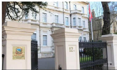
काठमाडौं/बिबिधका ३१ देशमा नेपालका राजदूतावास छन्।