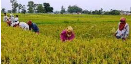
कृषि क्षेत्रले चाहेको विकास